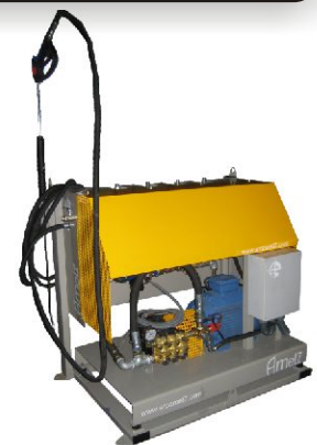
SISTEMAS DE LAVAGEM AUTOMÁTICO PARA MISTURADORAS COM CABEÇAS ROTATIVAS HIGH-PRESSURE CLEANING SYSTEM FOR MIXERS WITH ROTATING WATER SPRAY NOZZLES